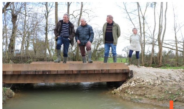
Elus sur passerelle du Landion (phase travaux)

Ce prix fait partie d'une stratégie de communication plus globale, développée dans le contrat Eau & Climat de l'Armançon , et le partenariat éducatif Récid'Eau , créé en 2020 par l'agence de l'eau, est apparu aux élus comme une réponse durable.