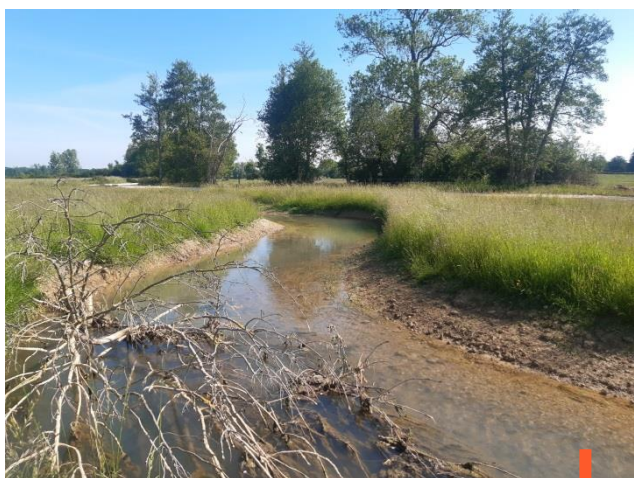
Embâche dans un méandre pour diversifier les habitats