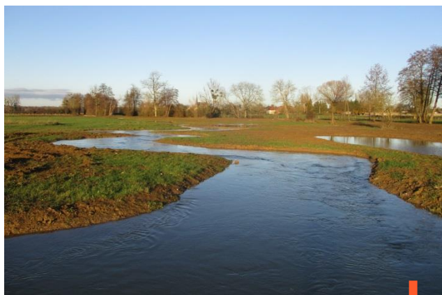
Landion et mare après remise en eau

leurs intérêts patrimoniaux et paysagers. Cinq mares, des noues, une plâtrière, deux observatoires ornithologiques, un sentier pédagogique sont quelques-uns des aménagements désormais ouverts au public."