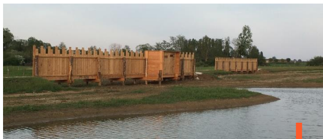
Observatoire du bord de la plâtrière

l'éducation. 942 000 € TTC ont été investis dans ce chantier, soutenu financièrement par l'agence de l'eau Seine-Normandie à hauteur de 860 000 € TTC.