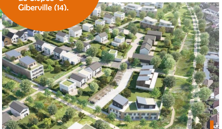
Perspective du projet : gestion à ciel ouvert des eaux pluviales rendue possible par la création de toitures végétalisées, de noues, d'espaces verts en creux

Aménagement de la première phase de la ZAC "Chemin de Clopée" à Giberville (14).