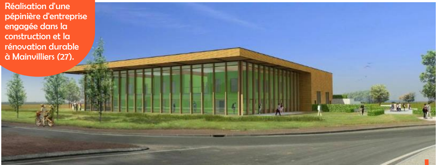
Perspective du futur bâtiment énergie Oxygène entouré d'espaces végétalisés permettant notamment la gestion des eaux pluviales

Réalisation d'une pépinière d'entreprise engagée dans la construction et la rénovation durable à Mainvilliers (27).