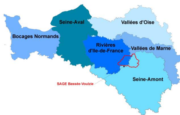
Carte 1 - Localisation du bassin versant Bassée-Voulzie

Pour ce faire, la C3P s'appuie sur la Commission territoriale responsable du bassin hydrographique. Le bassin versant Bassée-Voulzie relève de la Commission territoriale des Rivières d'Ile-de-France mais se situe sur plusieurs départements, qui concernent les membres de deux Commissions territoriales (carte 1) : département de la Seine-et-Marne pour les membres de la Commission territoriale des Rivières d'Ile-de-France, département de l'Aube pour les membres de la Commission territoriale Seine-Amont (deux autres départements sont concernés, Marne et Yonne, mais très faiblement).