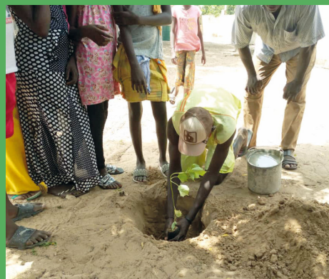
À Diender Kayar, la plateforme reboise