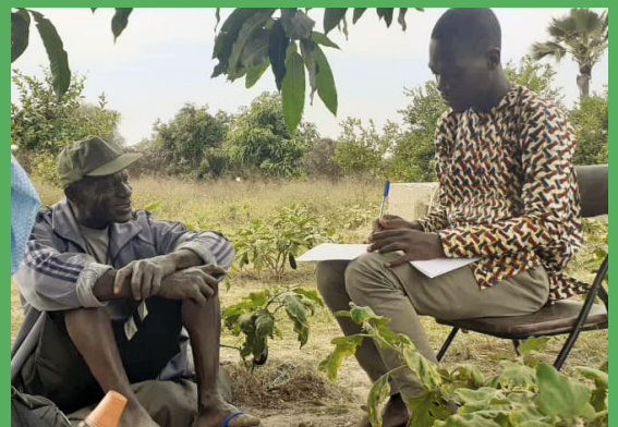
Entretien avec un agriculteur, membre d'une plateforme